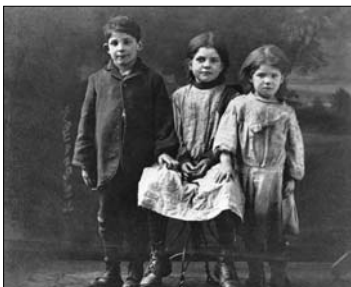
Enfants du Village-aux-Oies, Montréal, Qc, vers 1910, MP-1979.131

Il initie ensuite les élèves, en groupe, à la lecture d'une image, comme celle-ci , en l'affichant sur le site du Musée 6 .