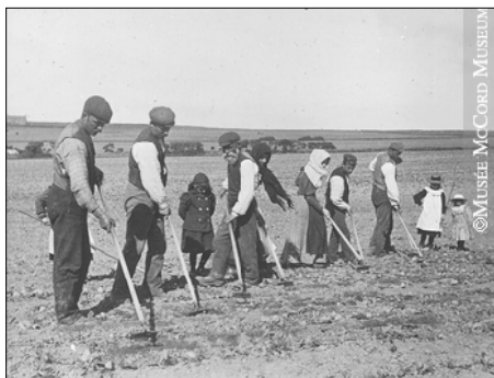
Famille occupée à sarcler, vers 1915 MP-0000.25.483

Pour la mise en situation (ou problématique ), l'enseignant affiche l'image suivante 7 et expose le problème que vit une famille (fictive) de 12 enfants habitant dans une région rurale du Québec vers 1900.